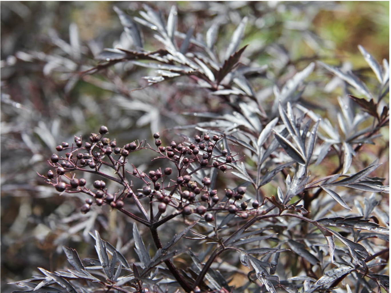
Schwarzer Holunder 'Black Lace'® • Sambucus nigra 'Black Lace'®

Mit Black Lace (s) bietet Firma Kientzler ein wirkungsvolles Schmuckgehölz, das mit dekorativer Blattfarbe und -form fasziniert.