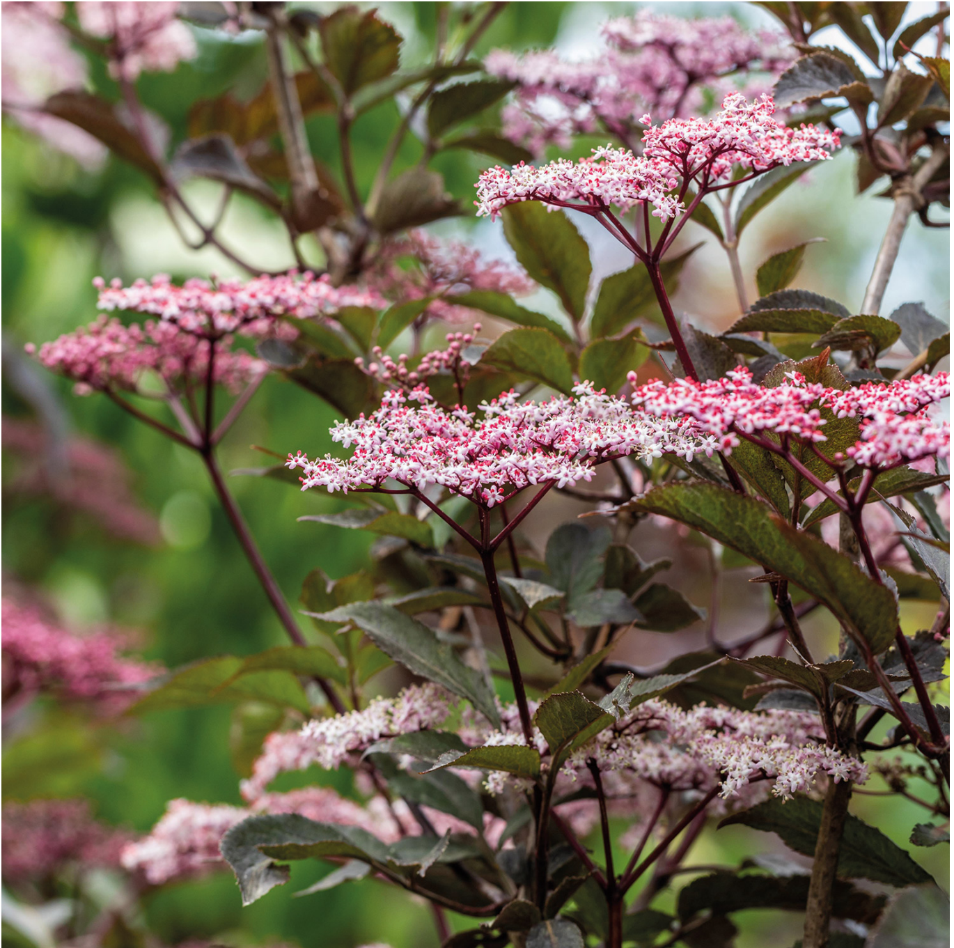
Dunkellaubiger Schwarzer Holunder 'Black Beauty' Container 80 -100 cm Liefergröße: 80 - 100 cm - Sambucus nigra 'Black Beauty'

'Black Beauty' - dunkle Schönheit mit hellem Gemüt! Bei Sambucus nigra 'Black Beauty' ist es, als würden sich zwei Welten in einer Pflanze vereinen. Eine dunkle und eine helle Seite, perfekt kombiniert! Die aus zehnjähriger Züchtungsarbeit herausgegangene Sorte beeindruckt mit dunkelbraunrotem bis fast schon schwarzen Laub. Leicht glänzend und gefiedert wirkt es äußerst elegant, mondän und voll von dunklem Charme. Im Herbst nimmt es eine leicht rötliche Färbung an. Ganz im Kontrast zu den dunklen