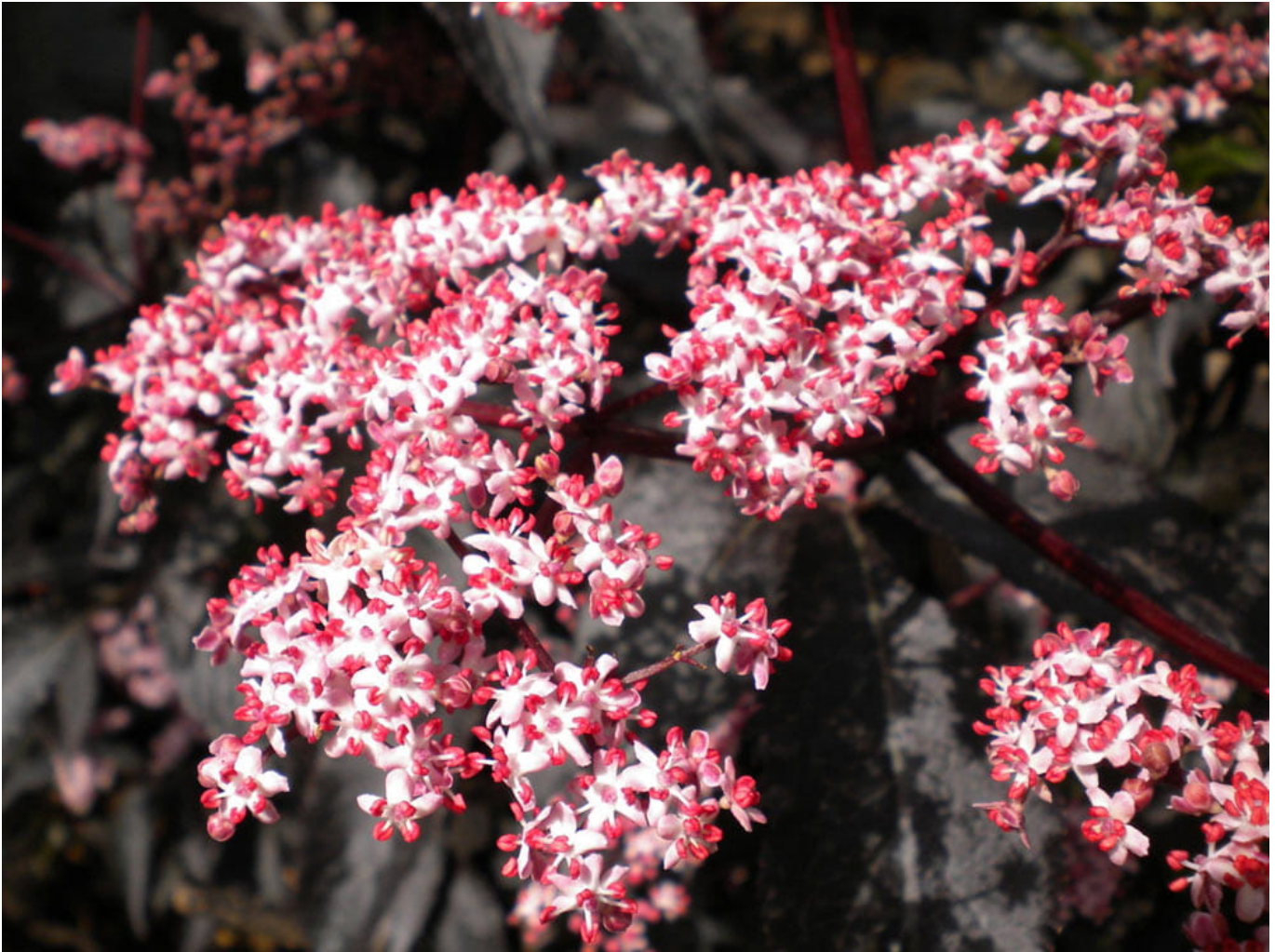
Fliederbeere 'Black Beauty' • Sambucus nigra 'Black Beauty'

Überprüfe deshalb die Eigenschaften und die tagesaktuellen Preise im Onlineshop unserer Partner.)